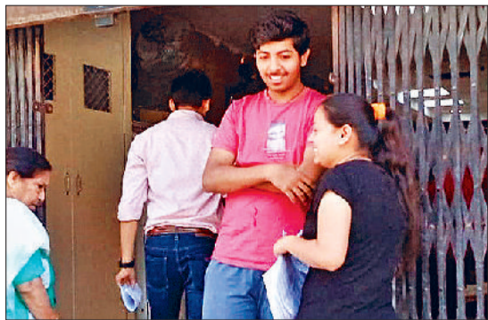
सोनीपत। साइट शुरू होने का इंतजार करते श्रद्धालु।

मॉडल टाउन स्थित पंजाब नेशनल बैंक (पीएनबी) में सर्वर डाउन होने के कारण अमर नाथ यात्रा पर जाने वाले लोगों के पंजीकरण व बायोमेट्रिक भी नहीं हो सके। जिसके कारण लोग परेशान दिखाई दीं। पीएनबी में कई घंटे तक लोग सर्वर ठीक होने का इंतजार करते रहे। दोपहर बाद तक भी लोगों को कोई राहत नहीं मिली तो उन्हें वापस लौटने के लिए मजबूर होना पड़ा। बता दें कि अमरनाथ यात्रा इस साल 29 जून से शुरू होगी और 19 अगस्त तक जारी रहेगी। श्रावणी मेले के दौरान हवाबा बफर्नह के दर्शन करने के लिए लोग