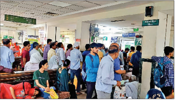
सोनीपत। ओपीडी में लगी भीड़ व चिकित्सक के आने के इंतजार में फर्श पर बैठकर इंतजार करते मरीज।

सुबह से दोपहर तक ओपीडी के समय अस्पताल में मरीजों की भीड़ जुटी अस्पताल में तैनात एक चिकित्सक कोर्ट एविडेंस टो चिकित्सक छुट्टी पर हरिभूमि न्यूज ▶▶ सोनीपत जिले के नागरिक अस्पताल में मरीजों को उपचार की सुविधा लेने में कड़ी मशकत करने पर मजबूर होना पड़ रहा है। बुधवार को चिकित्सकों की कमी के चलते मरीज परेशान रहे। उप सिविल सर्जन, डीएमएस समेत चार चिकित्सक तीन दिन की ट्रेनिंग के लिए दिल्ली स्थित एम्स गए हुए थे। एक चिकित्सक कोर्ट एविडेंस पर जाने व दो चिकित्सक छुट्टी पर रहे। जिसकी वजह से बुधवार को इलाज कराने के लिए पहुंचे मरीजों को लंबी लाइनों में अपनी बारी का इंतजार करना पड़ा। जिससे उन्हें काफी परेशानी का सामना करना पड़ा। बता दें कि दिल्ली स्थित अखिल भारतीय आयुर्विज्ञान संस्थान (एम्स) में दिव्यांगता प्रमाणपत्र बनाने के लिए गठित मेडिकल बोर्ड को प्रशिक्षण दिया जा रहा है। सोनीपत के जिला नागरिक अस्पताल से उप सिविल सर्जन समेत चार चिकित्सक दो