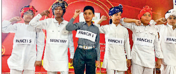
गन्नौर। पंचायती राज के महत्व को कविता, भाषण के माध्यम से समझाते हुए।

विद्यार्थियों ने पंचायती राज के महत्व को कविता, भाषण और एक्ट के माध्यम से समझाया