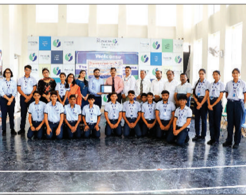
सोनीपत। कार्यक्रम के दौरान विद्यार्थियों के साथ क्लब के पदाधिकारी।