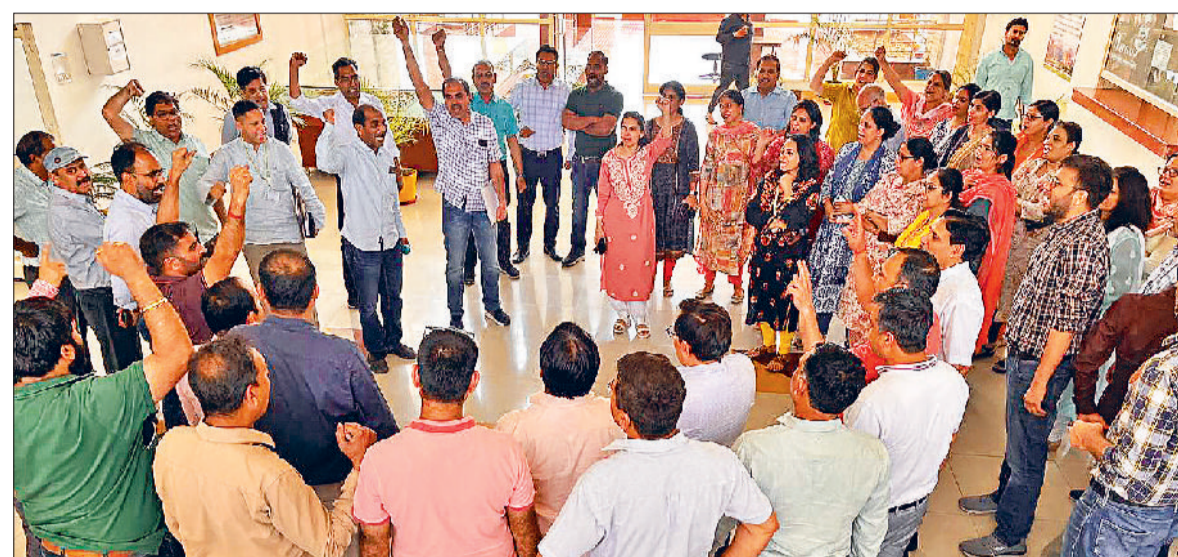
सोनीपत। विवि में प्रबंधन कार्यालय के बाहर विरोध जताते हुए डीक्यूटा के पदाधिकारी एवं सदस्यगण।

लेकिन अपने चहेतों को डीन के पद पर बिठाने के लिए एक्ट से छेड़खानी करके जान बूझ कर डीन की नियुक्ति में देरी की जा रही है। विश्वविद्यालय में कमेटी पर कमेटी बनाने का दौर जारी है, धरातल पर विश्वविद्यालय में कार्य शून्य है। पिछले दिनों में विश्वविद्यालय प्रशासन द्वारा एक आदेश के तहत आरटीआई की एक कमेटी का गठन सरकार के आदेशों की धज्जियां उड़ाते हुए किया गया। फिर कमेटी पर शोर मचता देखकर आनन फानन में कमेटी का फैसला वापस लिया।